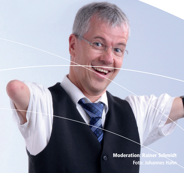
Moderation: Rainer Schmidt