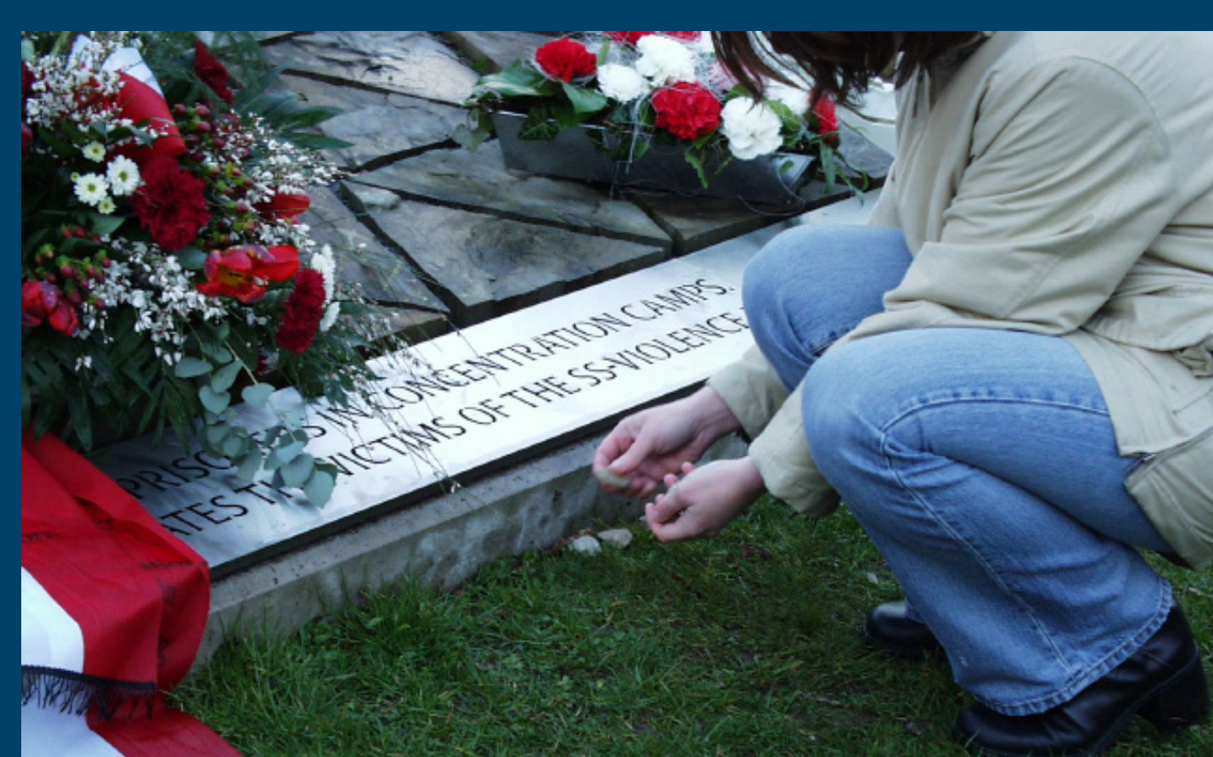
1.285 kleine Kieselsteine sollen an die Opfer des Konzentrationslagers erinnern.