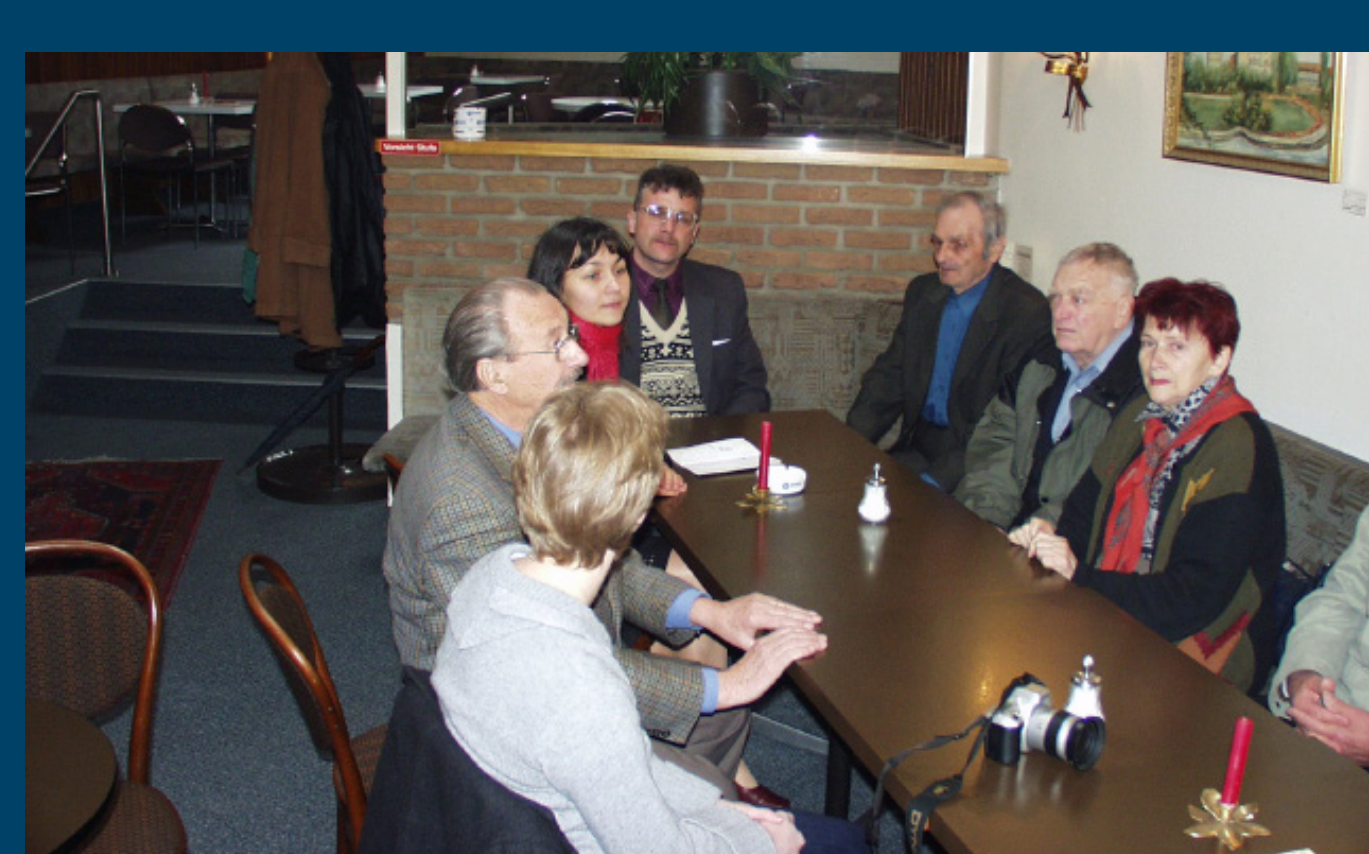
Nach dem Stadtrundgang besuchen die Überlebenden ein Restaurant.